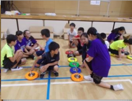
カローリング教室