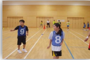
午前中は、スポーツ 鬼ごっこを学びました